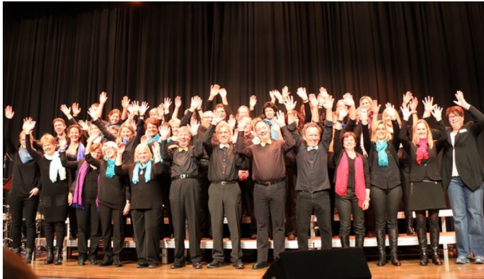
Grosse Freude über die erfolgreiche Seniorenweihnacht.